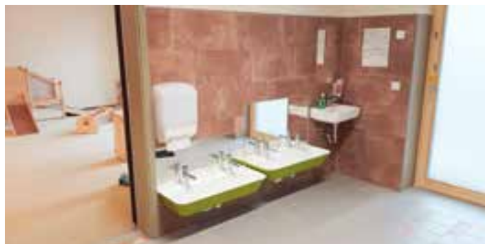
Angepasste Sanitäranlagen für unsere Kleinsten