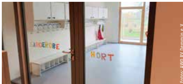
Große, helle Räume laden zum Spielen ein