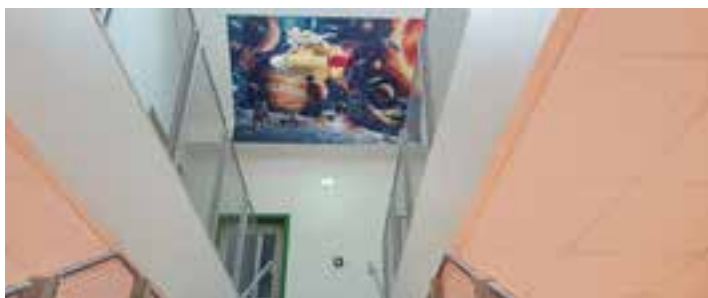
Leuchtende Kinderaugen erblicken eine Galaxie an der Decke