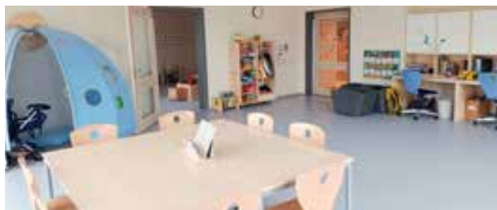
laden zum Spielen ein bitte herauslassen