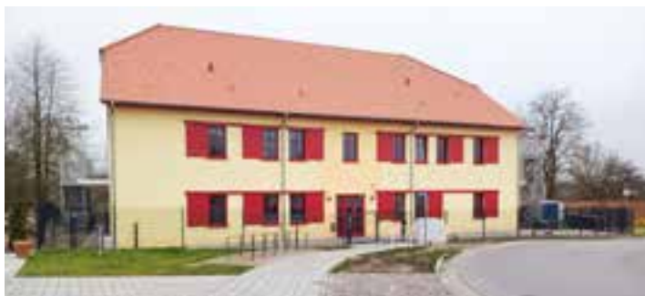
Eine einladende Außenfassade