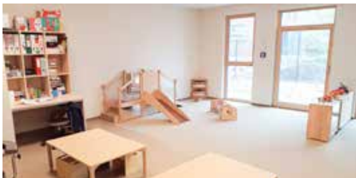
Ein Krippenraum der neuen Kita